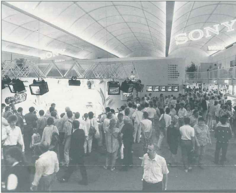
IFA-Atmosphäre, Informationen hautnah: Gedränge am Sony-Stand