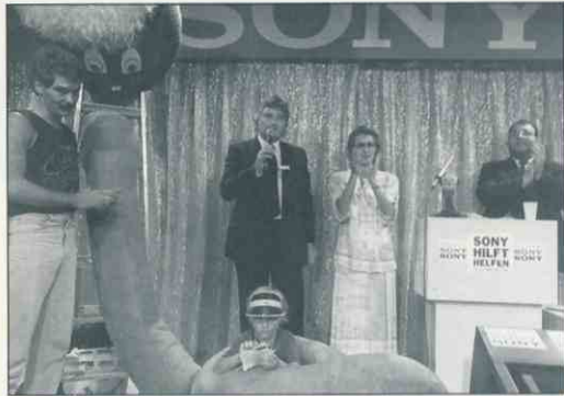
Sony hilft helfen: Auktion zugunsten krebskranker Kinder

Mit einer Länge von acht (!) Metern ist er der wohl längste Ohrwurm der Welt. Und dazu ein Riesen-PR-Gag, wie sein publicity-trächtiger Auftritt in der Samstagabend-Gala des ZDF zugunsten krebskranker Kinder bewies. Von wem ist da eigentlich die Rede, und wie ist es zu dem Fernsehauftritt gekommen?